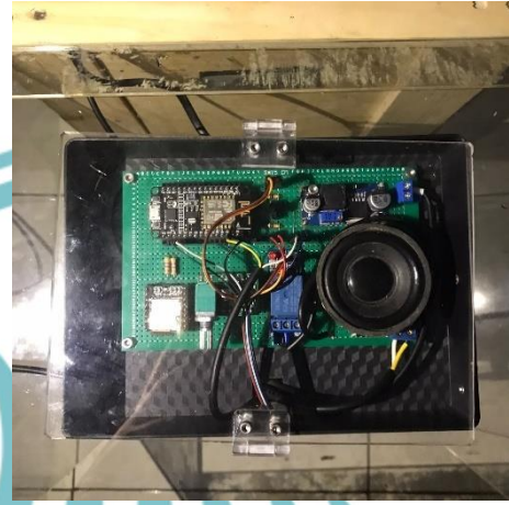
L2 3 Tampilan Alat