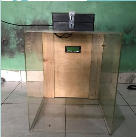
L2 1 Tampak Depan