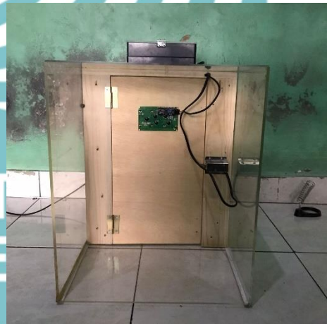
L2 4 Tampak Belakang