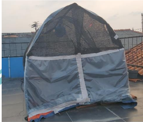
Gambar L- 1 Greenhouse