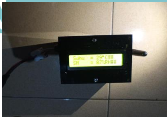
Gambar L- 3 Instalasi Panel 2 (RX)