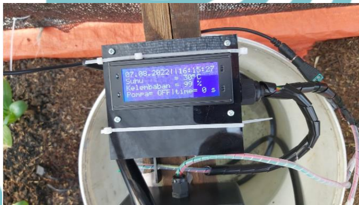
Gambar L- 2 Instalasi Panel 1 (TX)