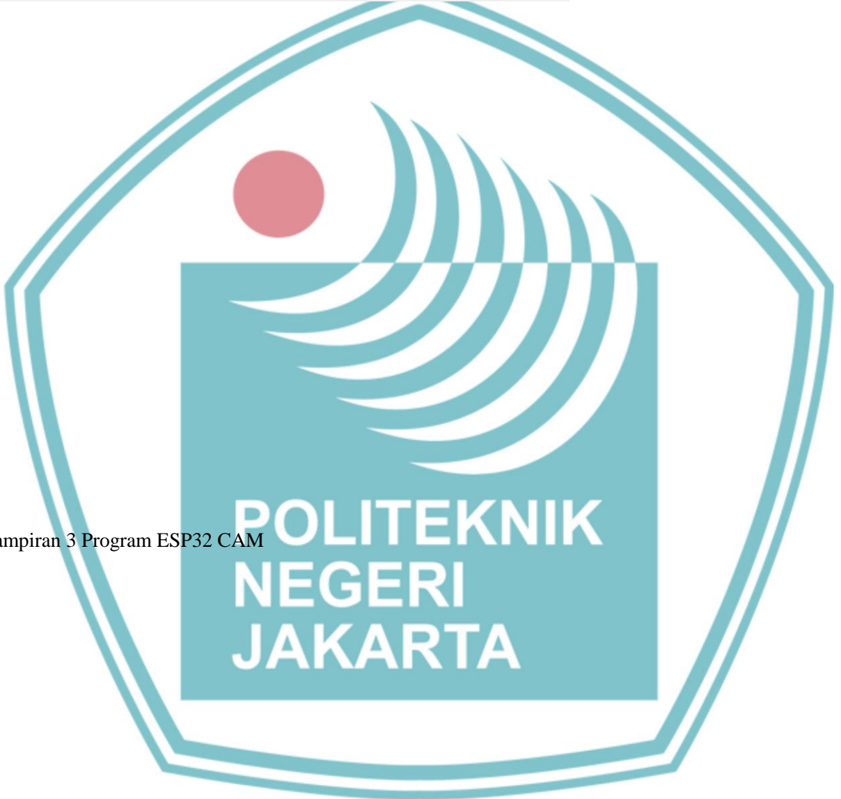
Lampiran 3 Program ESP32 CAM

else { digitalWrite(relay, LOW); //relay on digitalWrite(buzzer, LOW); //buzzer off //Firebase.setInt(firebaseData, path + "/Loker3/relay", 0); Serial.println("Loker Tertutup!"); Serial.println(""); delay(2000); } }