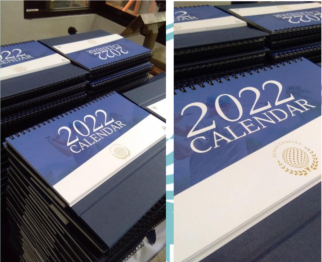
Lampiran 2. Produk kalender