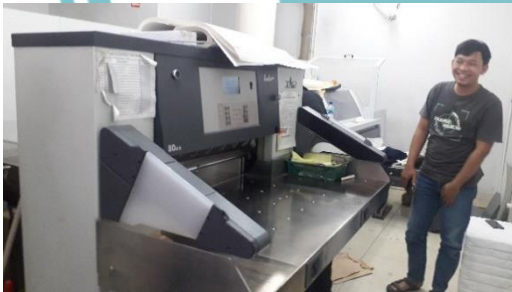
Wawancara dan observasi proses pemotongan dengan Bang Ari