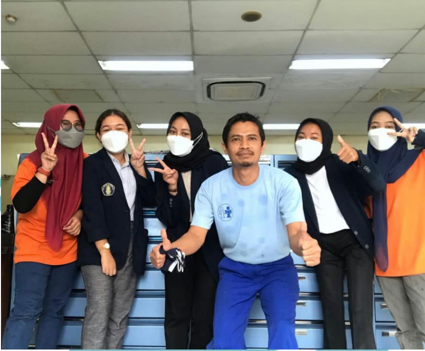
Dokumentasi bersama staf PT Cemani Toka