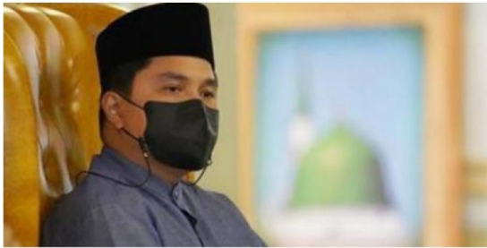
Menteri BUMN, Erick Thohir..

telusur.co.id - Pengamat kebijakan publik dari Universitas Trisakti Tribus Rahadiansyah mengapresiasi dan mendukung langkah tegas Erick Thohir yang telah mengumumkan pembubaran 3 BUMN yang tidak sehat dan sudah tidak beroperasi.