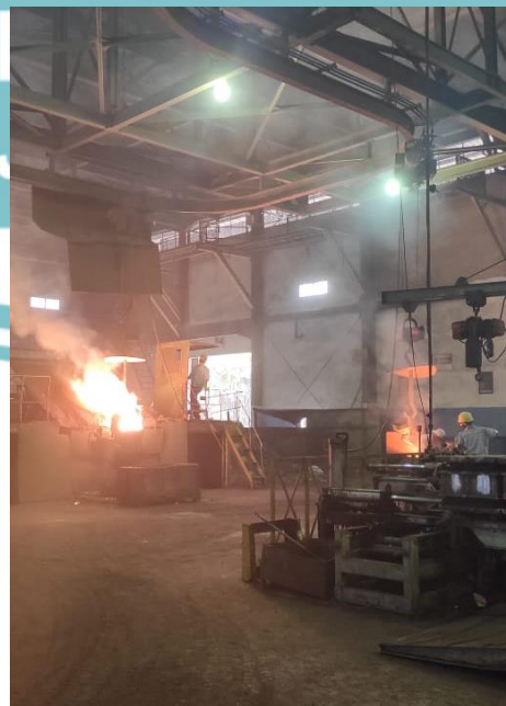
Lampiran 2. Foto Penempatan pada Divisi Foundry PT. BUMM