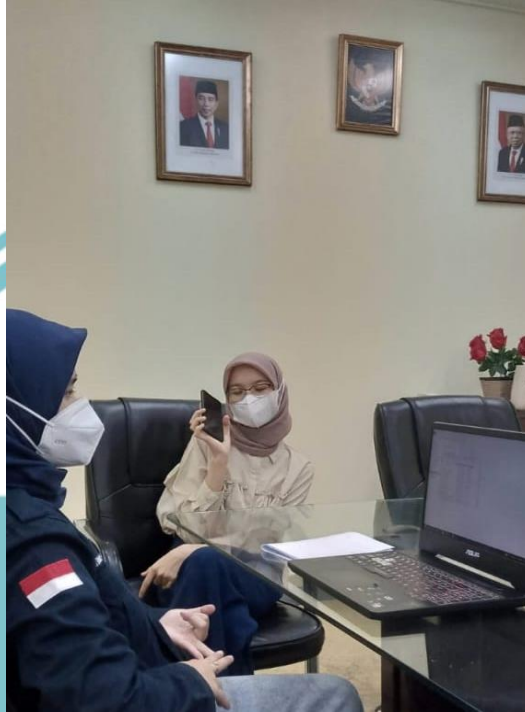
Lampiran 3. Foto Saat Diwawancara Oleh Bapak Wiwied (Head HRD)