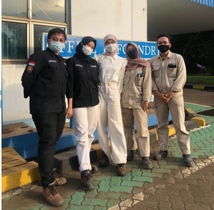
Lampiran 5. Foto Bersama Mahasiswa Praktik Kerja Lapangan PT. BUMM