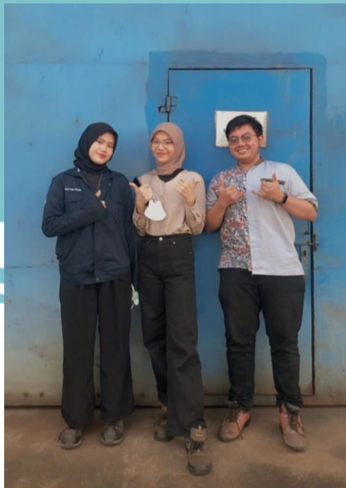
Lampiran 4. Foto Bersama Rekan Sejawar Praktik Kerja Industri PT. BUMM