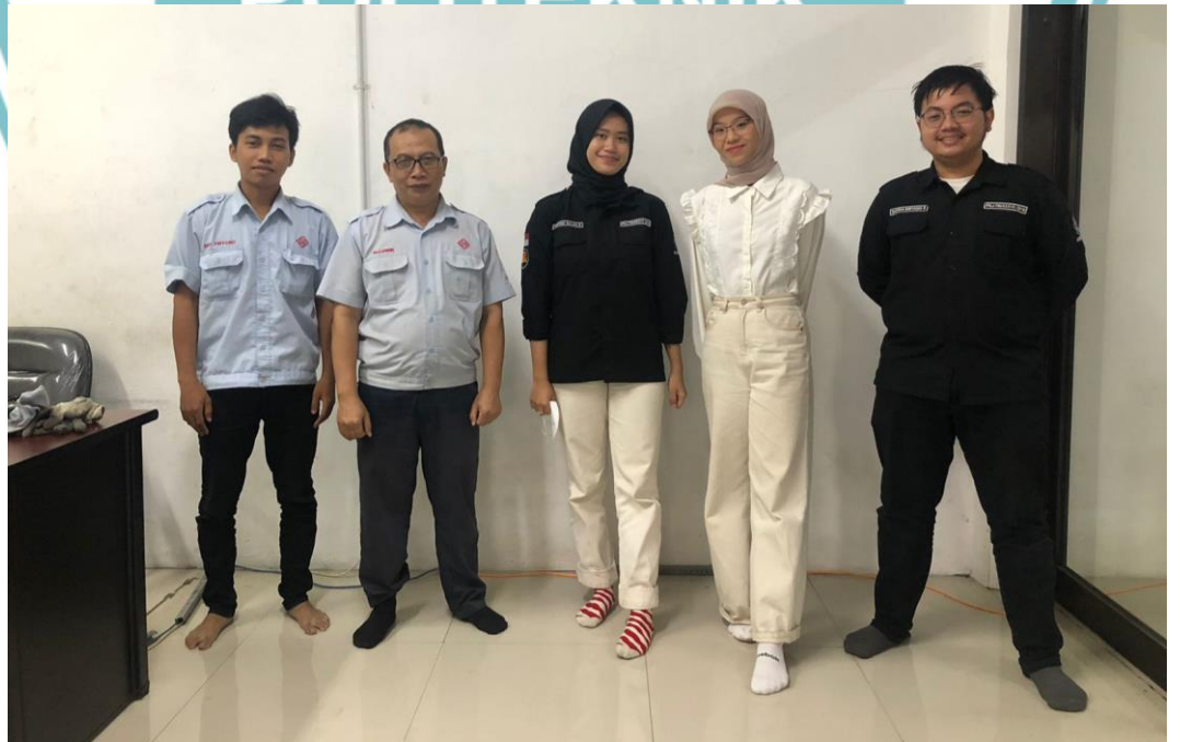
Lampiran 6. Foto Bersama Pembimbing Divisi Machining PT. BUMM