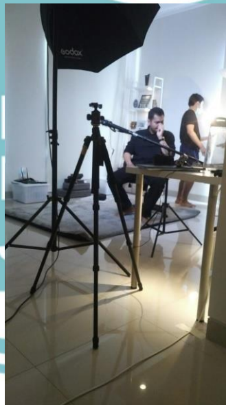
Foto ini adalah foto ruangan studio rekaman video tutor di Omaha village, BSD Tangerang.