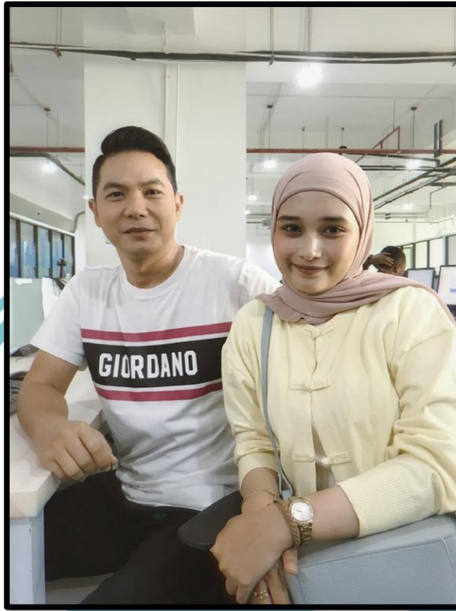
Foto Kegiatan Wawancara Tugas Akhir