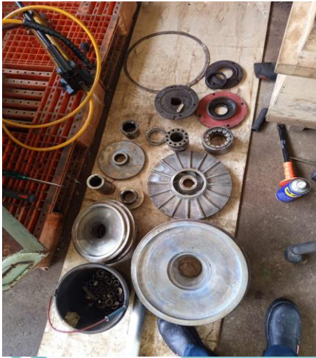
Lampiran 1. 1 Dokumentasi Kerja Praktik