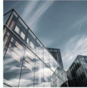
Logo & Identitas Our Logo & Identity