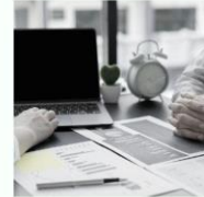
Jenis Huruf Font Type