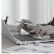
Brand Kita Our Brand