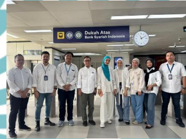
Corporate Event Peresmian Naming Rights LRT Jabodebek Dukuh Atas Bank Syariah Indonesia