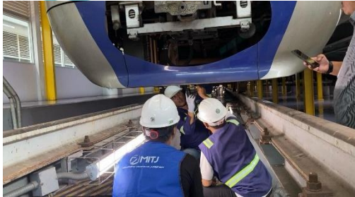
Dokumentasi Proyek CBM Dismantle