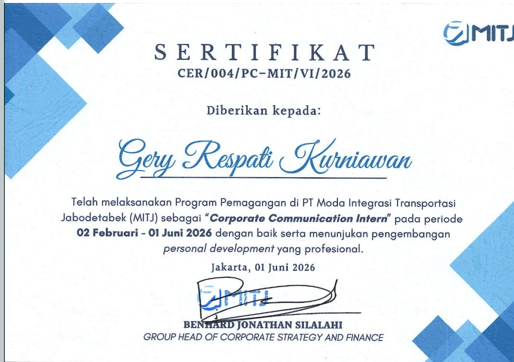
Lamp. 5 Sertifikat PKL