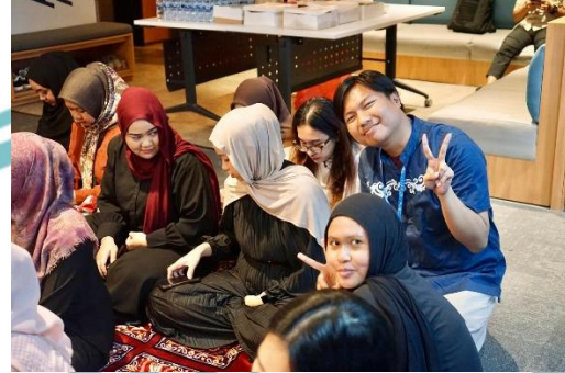
Kegiatan Buka Bersama dengan LRT Jabodebek