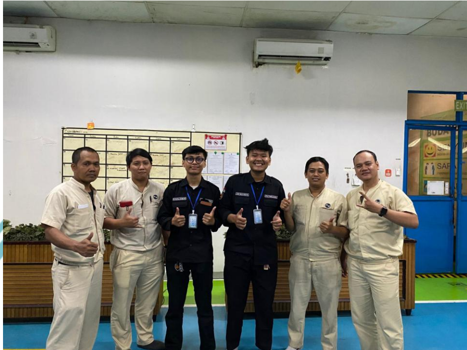
Lampiran 16 Bersama Para Staff Machining