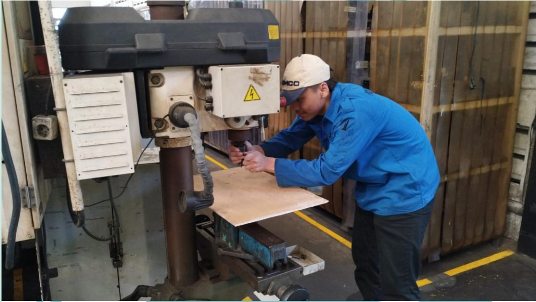
Lampiran 14 Memperbaiki Tombol ON pada Mesin Leak Test