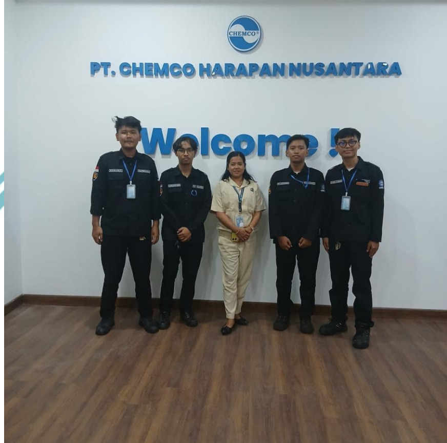
Lampiran 15 Foto dengan staff dan teman teman magang