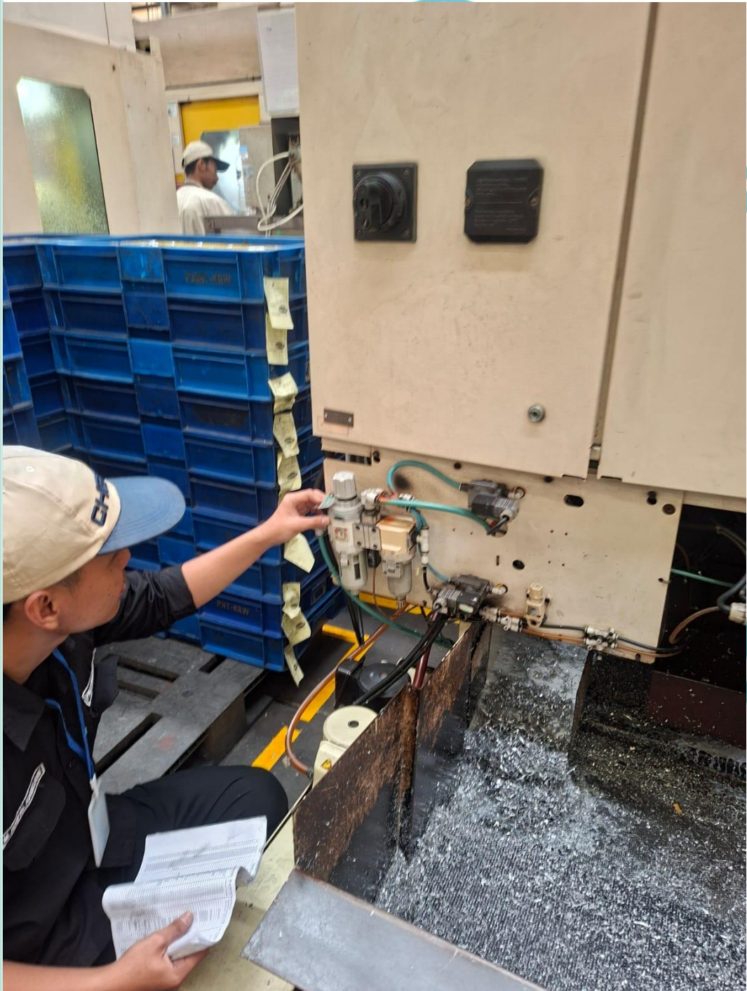
Lampiran 12 . Proses pengecekan tekanan angin mesin CNC