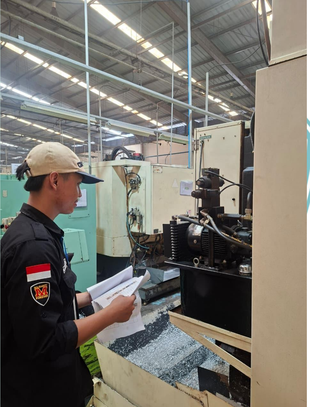
Lampiran 11 proses preventif pengecekan oli hidrolik