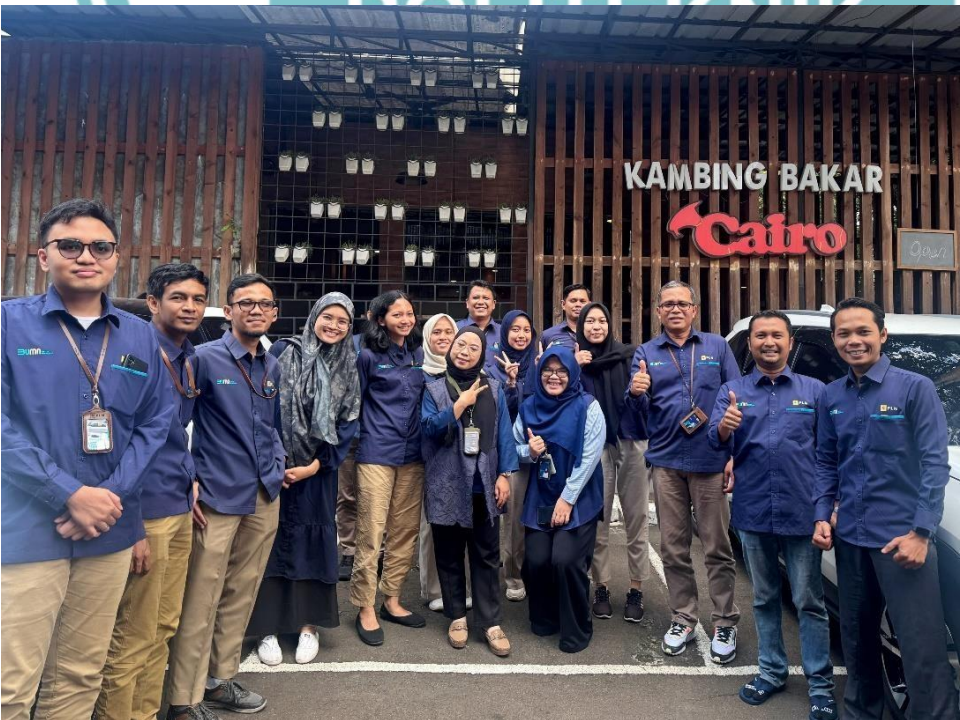
Lampiran II Foto Kegiatan Praktek Kerja Lapangan