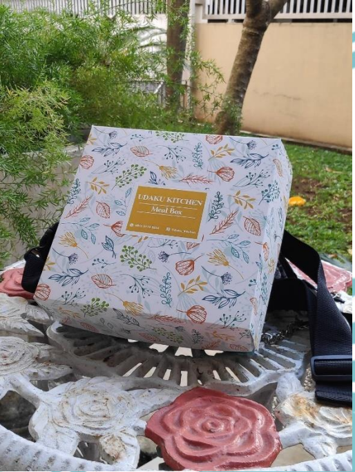
Foto Dokumentasi Kemasan Meal Box UDAKU KITCHEN yang lama