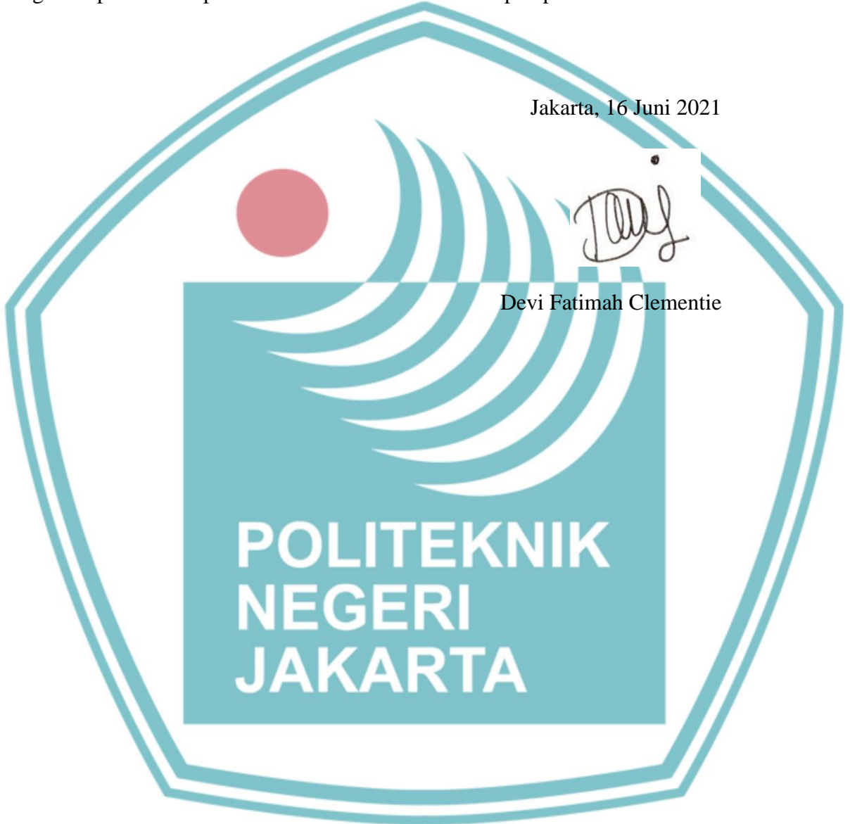
Devi Fatimah Clementie