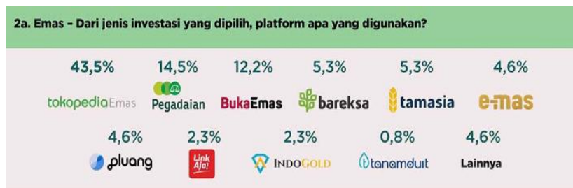
Gambar 1. 1 Aplikasi Investasi Emas Paling Populer Menurut Survei Dailysocial.id

2. Dilarang menggunakan dan memperbanyak sebagian atau seluruh karya tulis ini dalam bentuk apapun tanpa izin Politeknik Negeri Jakarta