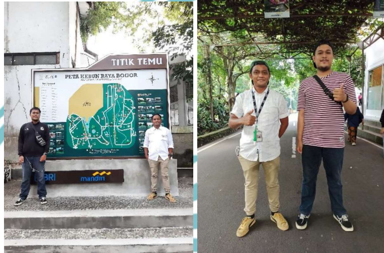
Foto bersama Pengunjung Kebun Raya Bogor Periode April – Mei 2021