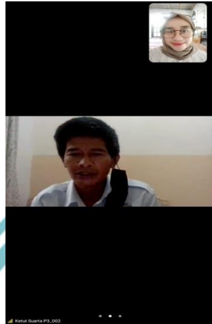
Lampiran 3 Wawancara Bersama Pengusaha Kena Pajak