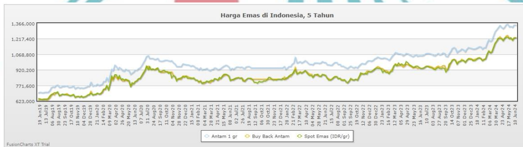
Gambar 1.1 Gambar Grafik tren Harga Emas dari Tahun 2019 – 2024

Perbandingan pada tahun – tahun sebelumnya yaitu tahun 2024 emas mengalami harga yang terbilang tinggi dibandingkan dengan tahun – tahun sebelumnya, dapat dilihat dari grafik tren harga emas berikut: