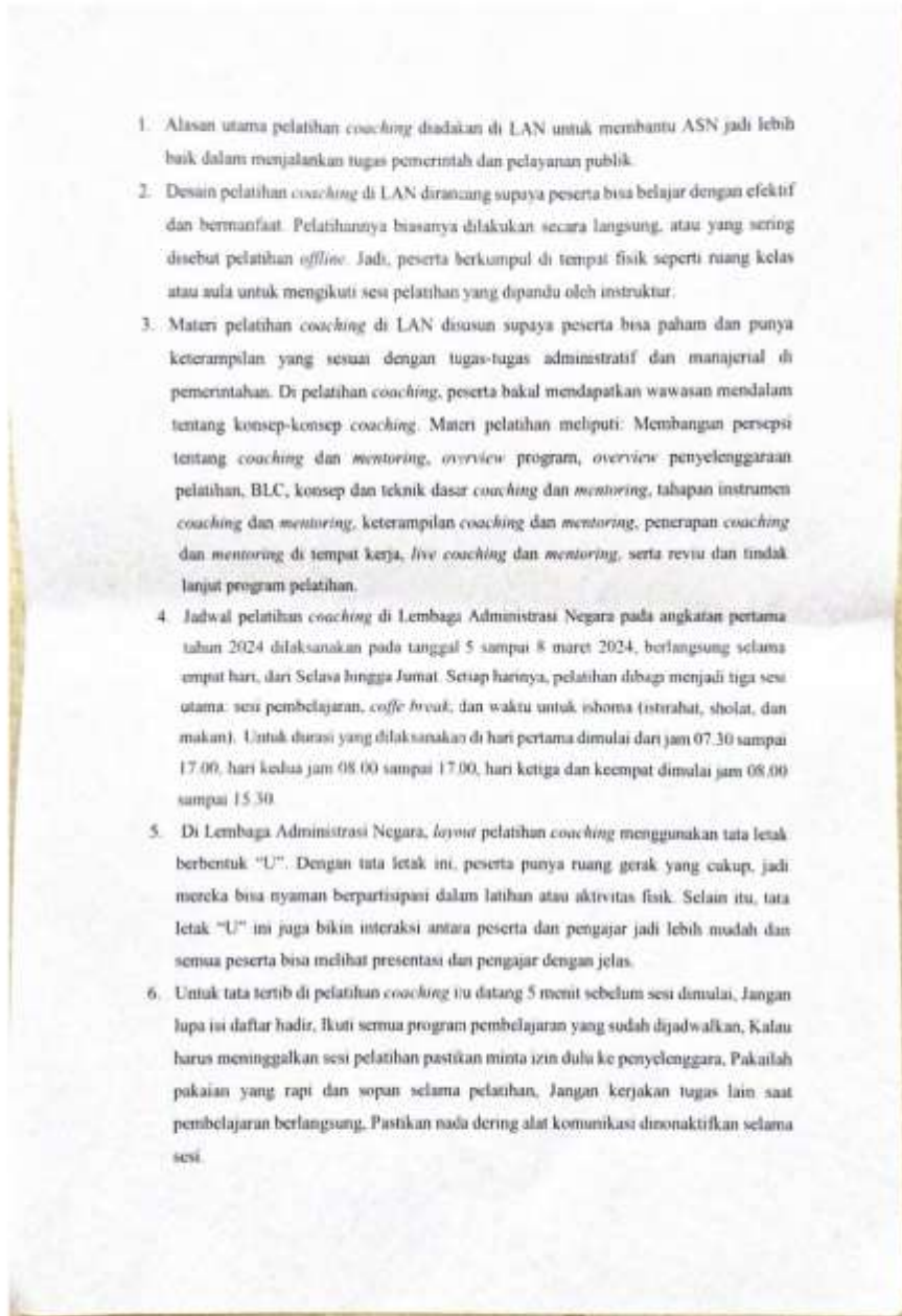
Lampiran 2 Daftar Jawaban Wawancara