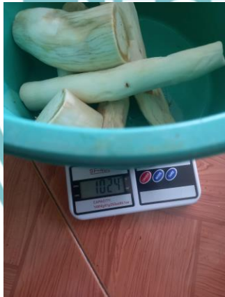
Gambar Pengujian Mesin Pengiris Singkong Modifikasi