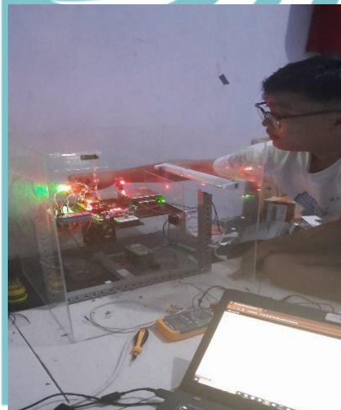
Pengujian Sensor MQ-7 dan MQ-135