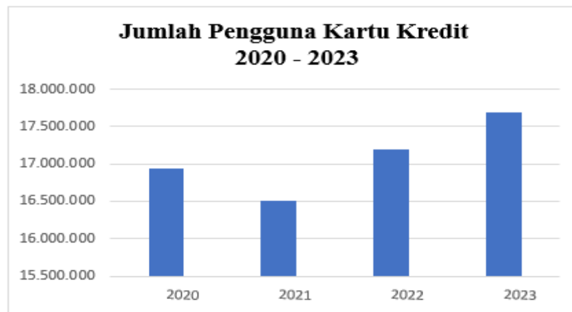
Gambar 1. 1 Jumlah Pengguna Kartu Kredit di Indonesia

Menurut data Asosiasi Kartu Kredit Indonesia (AKKI), total pengguna Alat Pemegang Menggunakan Kartu (APMK) di Indonesia semakin mengalami peningkatan tiap tahunnya. Berikut adalah grafik yang menunjukkan jumlah pengguna kartu kredit di Indonesia pada periode 2020 – 2023: (Asosiasi Kartu Kredit, 2023)