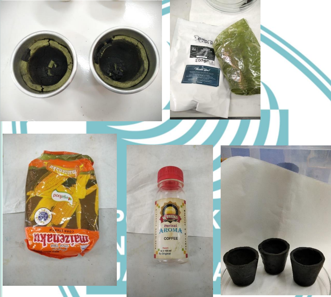
Lampiran 1 Trial dan Pembuatan Biodegradable Cup

© Hak Cipta milik Politeknik Negeri Jakarta