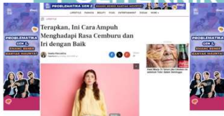
Gambar 1. 2 Berita judul teasing yang dimuat oleh Fimela.com

“Terapkan, Ini Cara Ampuh Menghadapi Rasa Cemburu dan Iri dengan Baik” pada kanal Lifestyle di Fimela.com. Judul ini masuk ke dalam clickbait jenis teasing , karena pada judul terdapat kata “ampuh” yang menggoda pembaca yang merasa terkait dengan perasaan cemburu dan iri.