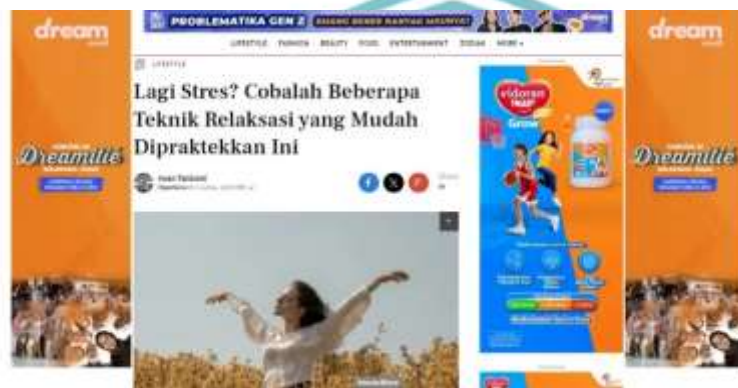
Gambar 1. 1 Berita judul exaggeration dan teasing yang dimuat oleh Fimela.com

dalam clickbait jenis exaggeration dan teasing , karena pada judul terdapat kata “cobalah” yang menggoda pembaca untuk mengklik judul berita dan kata “mudah” terkesan hiperbola untuk memperjelas fakta dari “Teknik Relaksasi”.