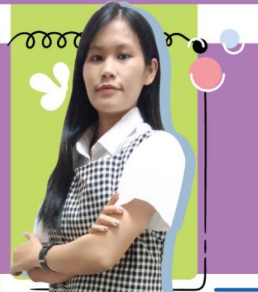
- Graphic Designer -

Has a great interest in the field of graphic design and illustration.