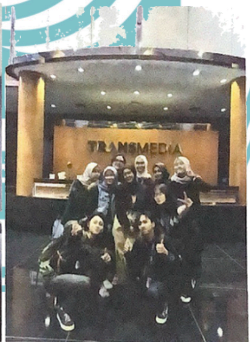
Foto bersama rekan-rekan MSIB Batch 6 HaiBunda.com di gedung Trans TV