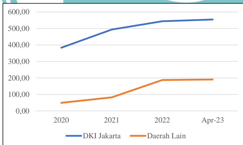
Gambar 1. 2 Perkembangan Uang Elektronik Periode 2020 - April 2023

Pengelolaan keuangan pribadi juga dipengaruhi oleh faktor lain yaitu adanya kemajuan teknologi dalam sistem pembayaran atau fintech payment . Pandemi Covid-19 berdampak terhadap penggunaan pembayaran non-tunai atau fintech payment yang semakin populer dan terjadi kenaikan pengguna (Wulandari, 2023). Berdasarkan Gambar 1.2. terjadi peningkatan penggunaan uang elektronik sejak tahun 2020 hingga April 2023, yang mana DKI Jakarta memiliki pengguna terbanyak dibandingkan dengan wilayah lain yang ada di Indonesia. Melalui Gambar 1.3 diketahui sebesar 72% pengguna uang elektronik berasal dari DKI Jakarta (Bank Indonesia, 2023). Kemudian, berdasarkan studi InsightAsia yang berjudul “Consistency that Leads : E-Wallet Industry Outlook 2023”, terdapat 74% responden aktif berbelanja menggunakan e-wallet atau fintech payment dibandingkan dengan pembayaran tunai atau transfer bank (Insight Asia, 2022).