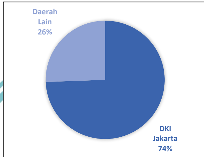
Gambar 1. 3 Persebaran Uang Elektronik Periode April 2023

Sumber : (Bank Indonesia, 2023), Data Diolah