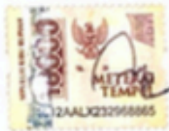
Avifah Sinta Suharyono