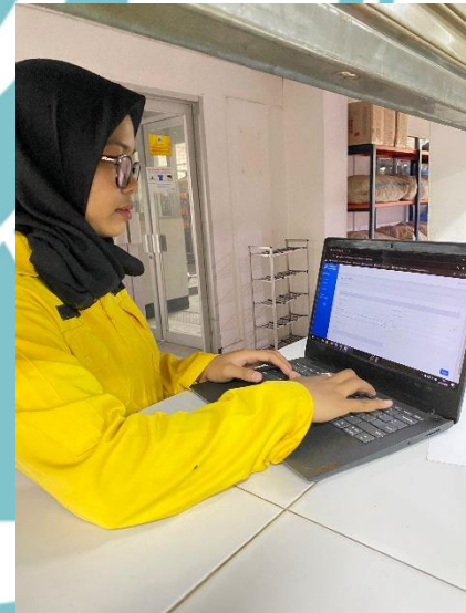
Gambar Realisasi alat di bengkel