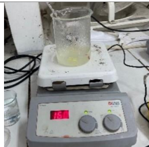
Larutkan pektin dan karagenan pada aquades dengan ditambahkan kitosan, gliserol, dan peppermint oil pada suhu 70°C selama 30 menit.