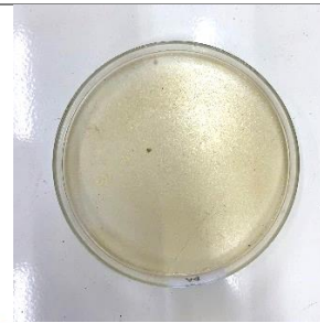
Bioplastik yang sudah kering dikeluarkan dan dinginkan selama satu hari untuk memudahkan pelepasan dari cawan.