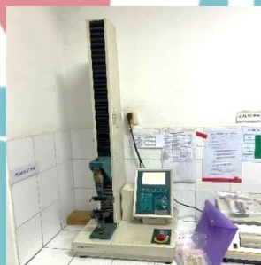
Kuat Tarik dan Elongasi