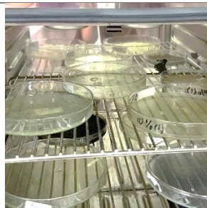
Larutan bioplastik yang sudah homogen dituang ke dalam cawan dan dikerignkan pada oven dengan suhu 60°C selama 12 jam.