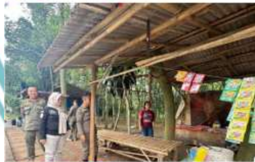
Proyek Raker KP Kecamatan Touristwing, Kecamatan PKL yang sudah di anggar akan jadi mangkrak