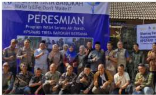
AQUA Ciherang meresmikan program WASH di kawasan KP-SPAMS Tirta Barokah Desa Ciherang Pondok, Jumat (28/6/2024).