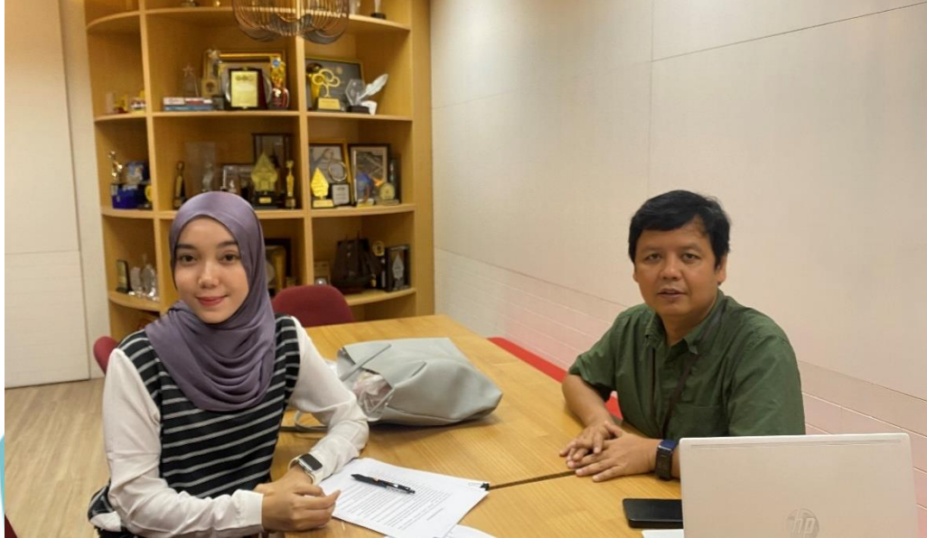
Sesi wawancara secara langsung bersama Managing Editor kanal Regional di Kompas.com