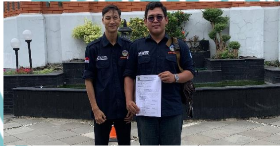
Gambar : Komunikasi dan koordinasi dengan Kemitraan.