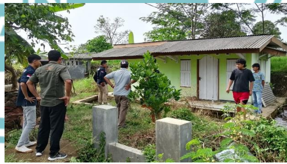
Gambar : Sosialisasi dan Survei Lokasi Program Kecakapan Wirausaha ke Beberapa Desa.