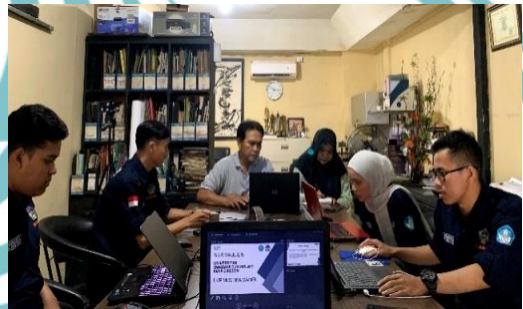
Gambar : Onboarding Mitra, Briefing Divisi, Sosialisasi Dirjen Vokasi, Materi dari Mentor