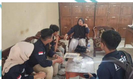
Gambar : Sosialisasi Program Kursus Otomotif dan Mengemudi ke Sekolah.