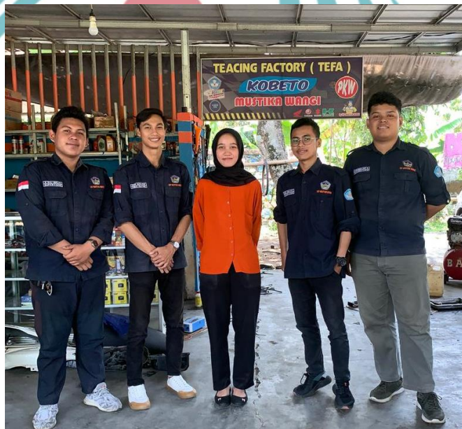
Gambar : Kunjungan ke Teaching Factory Kelompok Bengkel Otomotif (KOBETO)