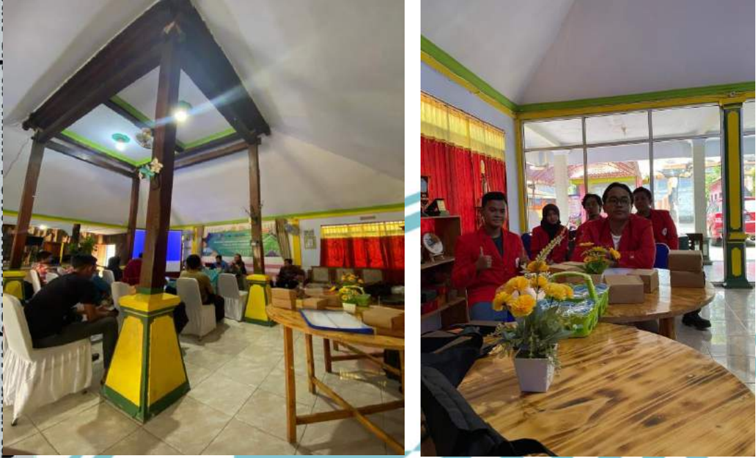
Gambar 5 Sosialisasi Sistem IOT PLTS kepada warga setempat