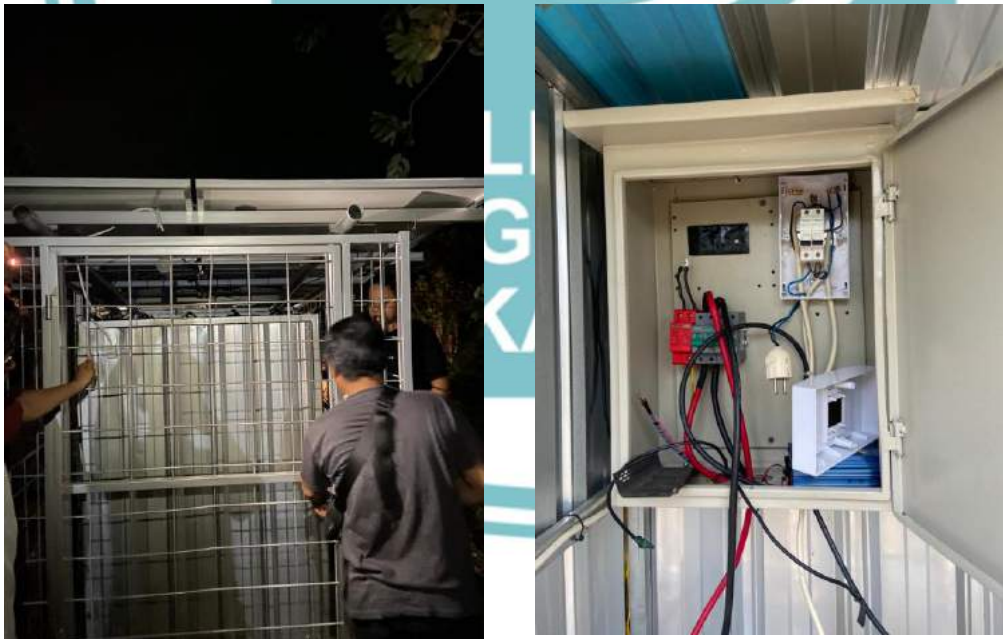
Gambar 1 Pengecekan Komponen PLTS