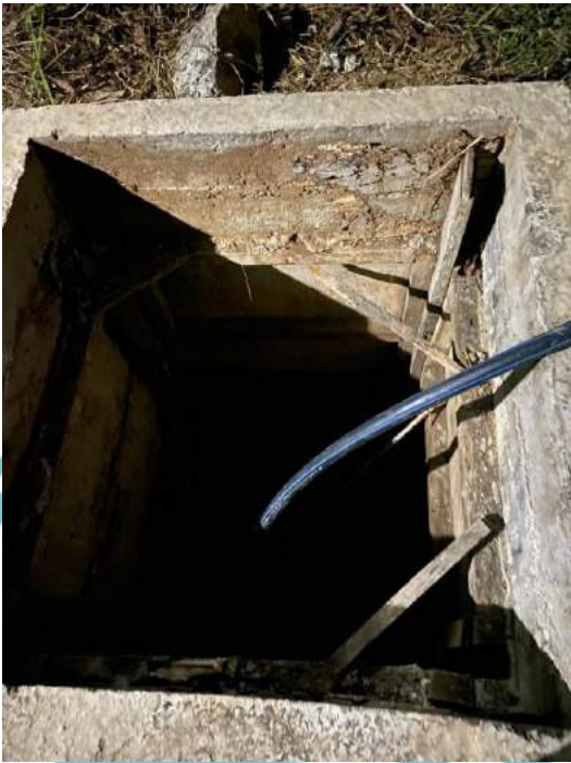
Gambar 3 Lokasi Penampungan Air Sungai