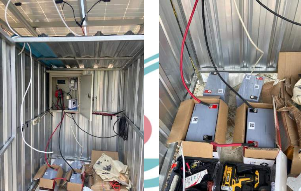
Gambar 2 Penggantian baterai PLTS