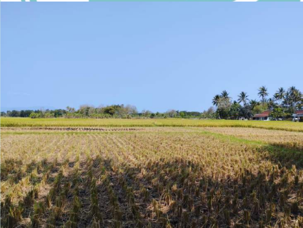
Gambar 4 Lokasi Sawah yang dialirkan Air menggunakan pompa PLTS