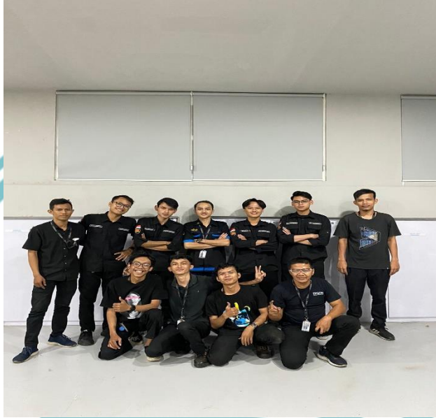
Lampiran 9 Dokumentasi bersama rekan engineering dan manager