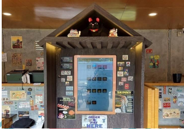
Gambar 1. 1 System Self Service Sai Ramen Jakarta