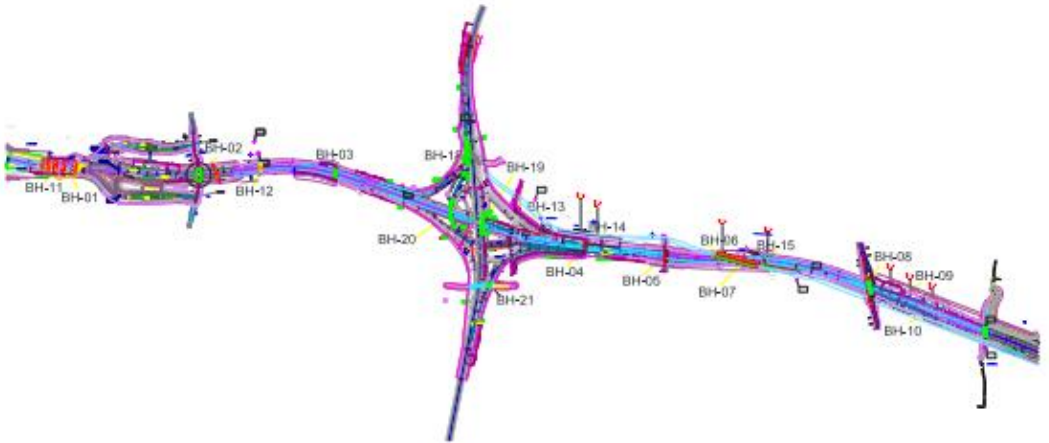
Gambar. 2 Denah Lokasi Bore Log