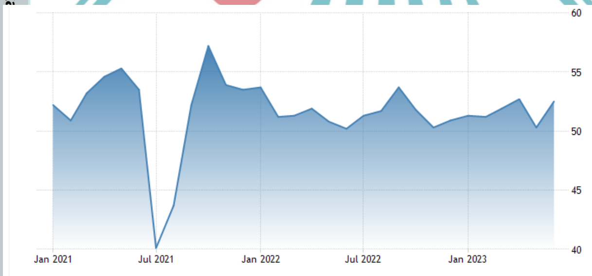
Gambar 1.1 PMI Indonesia Periode Januari 2021- Juni 2023

mengenai perkembangan kondisi pasar suatu negara (Barnier, 2023). Khundrakpam dan George (2019) dalam Jayathilaka, et al. (2022) menjelaskan bahwa PMI dianggap predictor yang baik dalam kegiatan ekonomi. Pada April tahun 2020, nilai yang diperoleh Indonesia menurun hingga 31,37 dibawah nilai ambang aman yaitu 50 selama dua bulan berturut-turut (Julianto, Gemilang, Hanifa, Begin, & Fauzan, 2022). Menurut penelitian yang dilakukan oleh Koenig (2002) menggunakan dua puluh sampel data, peneliti menyimpulkan pertumbuhan suatu negara memiliki kecenderungan positif atau negatif ditentukan dengan nilai PMI diatas atau dibawah 47. Nilai selama dua bulan ditahun 2020 menunjukkan nilai kinerja manufaktur mengalami resesi. Indikator ini menunjukkan bahwa terjadi penurunan pada lima aspek yaitu pesanan baru, tingkatan persediaan, produksi, pengiriman pemasok, dan pekerjaan.