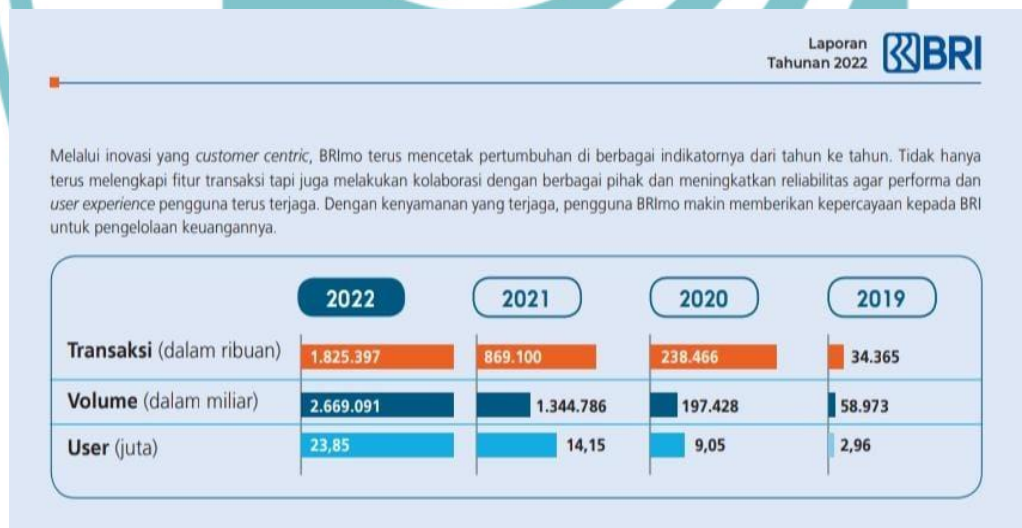
Gambar 1.5 Infografis pertumbuhan BriMo

Dari Tabel 1.1. diatas, terlihat jumlah nasabah Bank BRI dalam kurun waktu 3 Tahun. Di tahun 2020 sebanyak 70 Juta nasabah, ditahun 2021 sebanyak 89 juta nasabah dan di tahun 2022 sebanyak 98 Juta nasabah. Dalam waktu kurun 3 tahun tersebut nasabah Bank BRI selalu mengalami peningkatan.