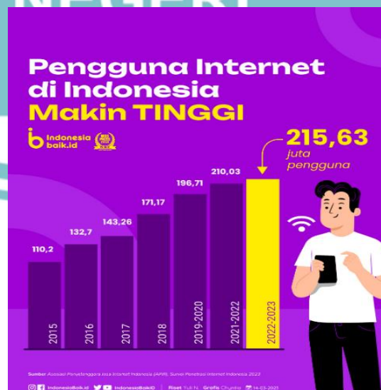
Gambar 1.1 Pengguna Internet di Indonesia

Perkembangan teknologi sangatlah pesat yang mana hal tersebut dapat memberikan berbagai pengaruh positif di tengah perkembangan zaman. Adapun pengaruh perkembangan teknologi ini bukan hanya dinikmati oleh sebagian masyarakat, melainkan hampir semua masyarakat dapat merasakannya. Salah satu teknologi yang digunakan adalah internet. Di Indonesia sendiri terutama dalam beberapa tahun terakhir penggunaan internet tampak semakin berkembang. Di karenakan teknologi semakin canggih dan terus berkembang. Internet dibutuhkan untuk memberikan kemudahan dalam melakukan kegiatan dalam segala aspek. Hal yang biasa dilakukan seperti mencari informasi, berkomunikasi, bekerja, berbelanja, hingga melakukan transaksi pembayaran. Dengan adanya aktivitas yang dilakukan melalui internet tersebut dapat diakses dengan menggunakan handphone atau gadget dengan bantuan internet. Menurut data hasil peninjauan periode 2022-2023 oleh Asosiasi Penyelenggara Jasa Internet Indonesia, 215,63 juta penduduk teridentifikasi sebagai pengguna internet di Indonesia. (Indonesiabaik.id, 2023).