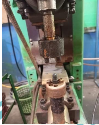
Gambar 1.1 Jig Spot Welding Upper Support