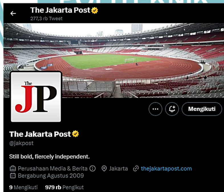
Figure 1.1 The Jakarta Post Twitter Account

The Jakarta Post is an English-language daily newspaper in Indonesia. The news media is owned by PT Bina Media Tenggara headquartered in the national capital, Jakarta. The Jakarta Post has print and online newspapers using The Jakarta Post website ( www.thejakartapost.com ). In addition, The Jakarta Post also has social media on various platforms, one of the social media is Twitter. The Jakarta Post account on Twitter is used to post the latest news for Twitter users. The Jakarta Post account itself currently has 979 thousand of followers. This account will write a news caption with a link from The Jakarta Post website.