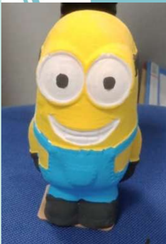
Anak Gadis Kecil