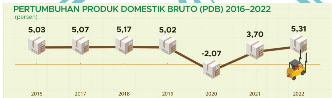
Gambar 1.1 Grafik pertumbuhan PDB tahun 2016 - 2022

Tahun 2020 merupakan tahun dimana Indonesia dihebohkan dengan wabah virus covid-19. Virus covid-19 kala itu melumpuhkan seluruh kegiatan dan mengganggu berbagai sektor yang ada di Indonesia. Hal ini menyebabkan banyak sektor ekonomi industri yang terkena dampaknya. Badan Pusat Statistik menyebutkan Indonesia mengalami penurunan ekonomi dari Produk Domestik Bruto (PDB) terparah sebesar -5,32% pada kuartal kedua tahun 2020.