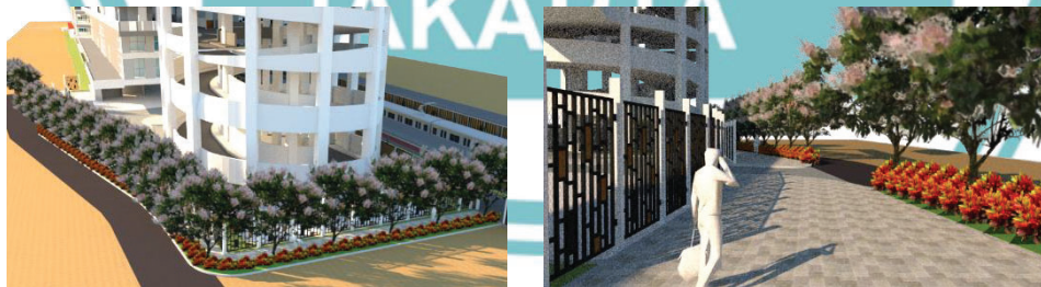
Simulasi green wall menggunakan modul VGM