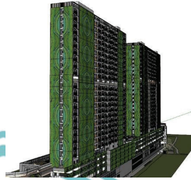
Simulasi green wall menggunakan modul VGP