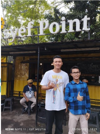
Wawancara dengan RICMA Masjid Cut Meutia