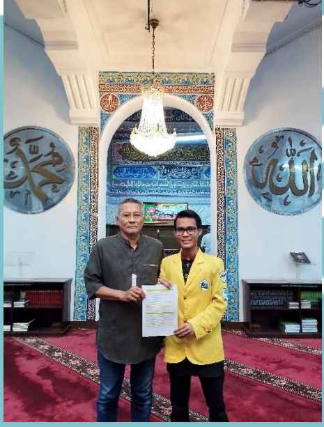
Valisasi Faktor Internal & Eksternal