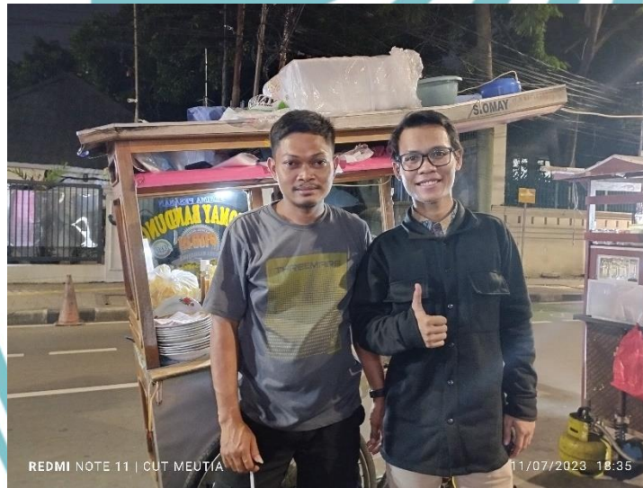
Wawancara dengan UMKM Binaan Masjid Cut Meutia