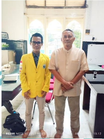
Wawancara dengan Ketua DKM Masjid Cut Meutia Pak Koko