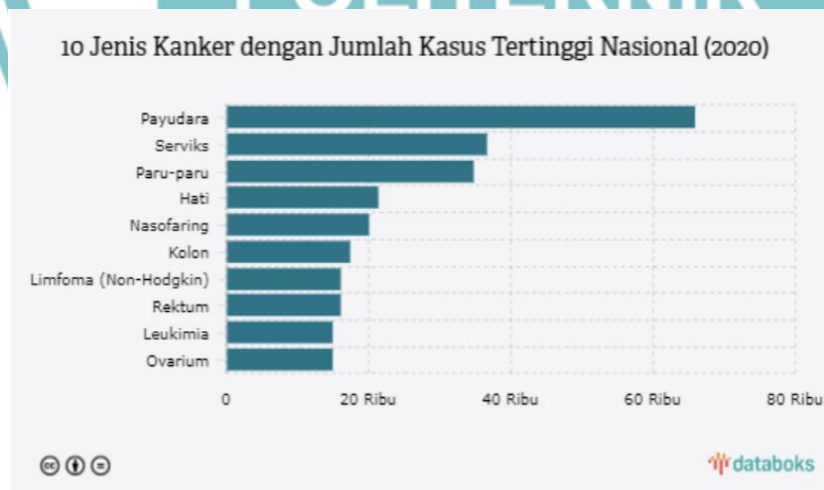
Gambar 1. 2 10 Jenis Kanker dengan Jumlah Kasus Tertinggi Nasional (2020)