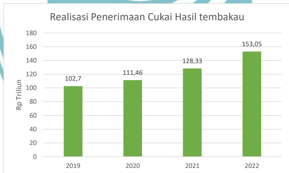
Gambar 1.2 Penerimaan Cukai Hasil Tembakau

Walaupun demikian perusahaan yang berada pada sektor manufaktur ini juga menjadi salah satu sektor yang telah banyak membantu pertumbuhan perekonomian di Indonesia. Karena pada sektor ini mempunyai peran penting bagi keberlangsungan hidup manusia, seperti makanan, kesehatan, dan lain-lain. Selain perusahaan makanan dan minuman, perusahaan sektor manufaktur juga berkontribusi besar dan signifikan terhadap perekonomian Indonesia (Kemenperin, 2017). Hal tersebut dapat dilihat dari penerimaan cukai hasil tembakau yang meningkat di setiap tahunnya. Perusahaan dengan barang yang mempunyai karakteristik sesuai yang ditetapkan Undang-Undang wajib mengeluarkan biaya atau dikenal dengan cukai.