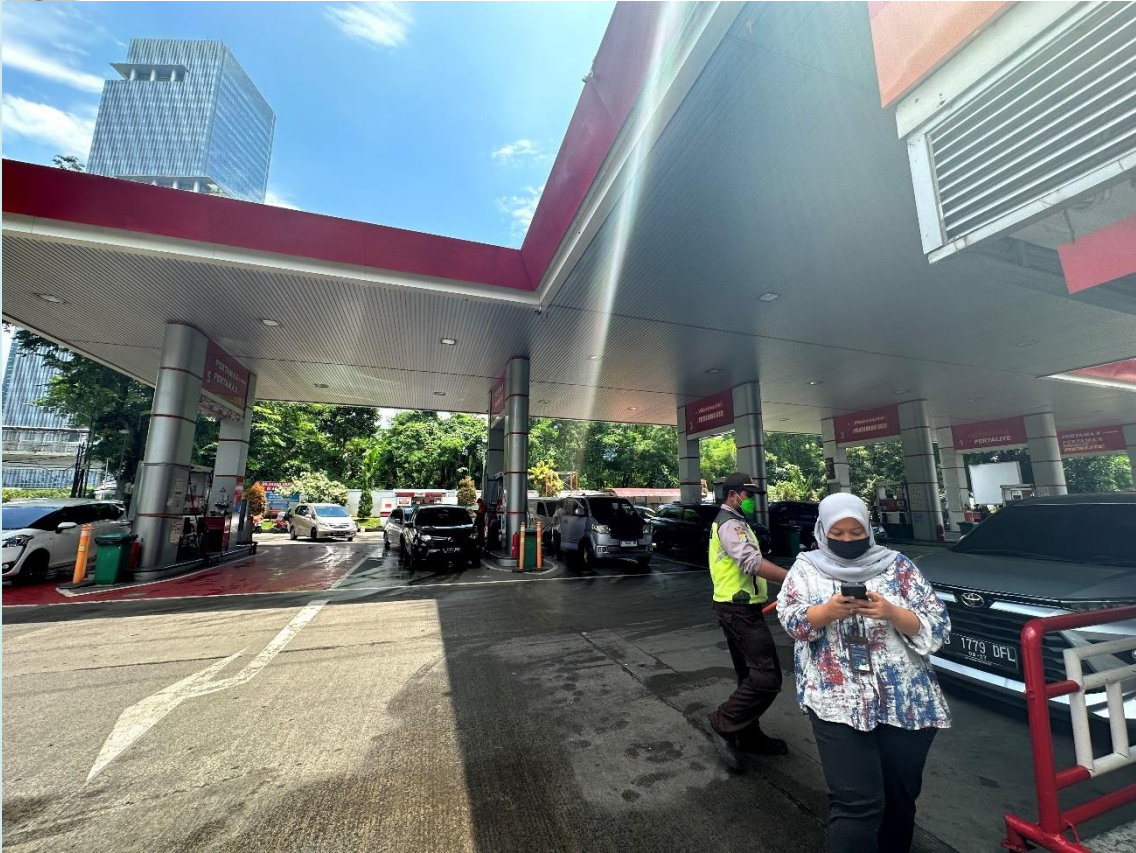
Lampiran 3. Foto Lokasi SPBU Gatot Subroto 1